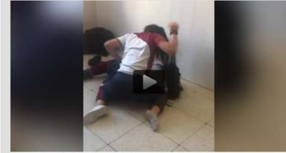
Una adolescente de 12 años deja inconsciente de una paliza a otra en su instituto.